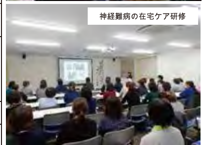
神経難病の在宅ケア研修