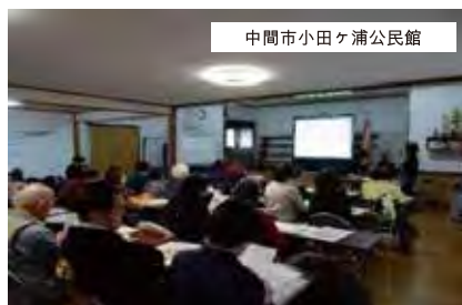
中間市小田ヶ浦公民館

参加された方からの感想は様々で、「在宅医療はいいと思うけど一人暮らしだとどうなるのだろう」と思われる方や、「今後の生活の選択肢の一つに考えたい」という感想もあり、在宅医療について考える機会となっているようです。