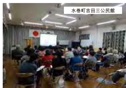
水巻町吉田三公民館

地域の公民館や地域交流センターなどへ、在宅総合支援センターの職員がお伺いし、「在宅医療について」の出前講座を行っています。平成29年7月から開始し、平成30年2月までの間に30箇所の公民館で851名の方にご参加いただきました。