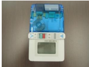
カフティポンプ カフティポンプS ※指定のチューブセット (各医療機関で準備)