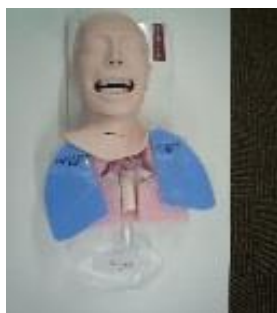
吸引シミュレータ 坂本モデル