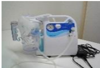
ポータブル吸引・吸入両用器 セパDC-Ⅱ (NSD2-1400)