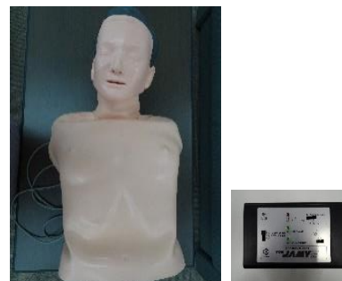
蘇生型人体モデル JAMY II