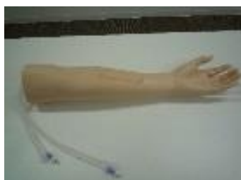
点滴静注シミュレータ