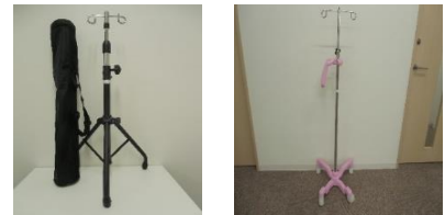
点滴スタンド 携帯用(折り畳んで収納) グリップ付き・キャスター4輪