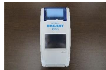
携帯用血液ガス分析器 GASTAT-navi 別途：試薬あり (有料 1125円/回)