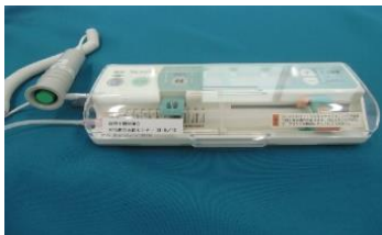
PCAポンプ テルフュージョン 小型シリンジポンプTE-361