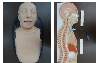
経管栄養シミュレータ MV8