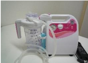
ポータブル吸引器 ミニックDC-Ⅱ (MWD2-1400)