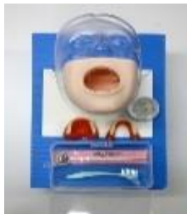
口腔ケアモデル セイケツ君