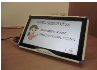
物忘れ相談プログラム TDASプログラム 物忘れトレーニングプログラム (MSP-1100)