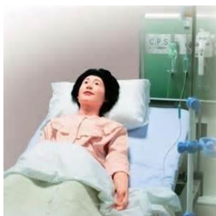
万能型成人実習モデル さくらII