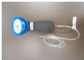
カフ圧計 (気管内チューブインフレーター) ハイ・ロー・ハンドカフ圧ゲージⅡ