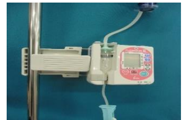
輸液ポンプ フローサイン2 (自然落下式)